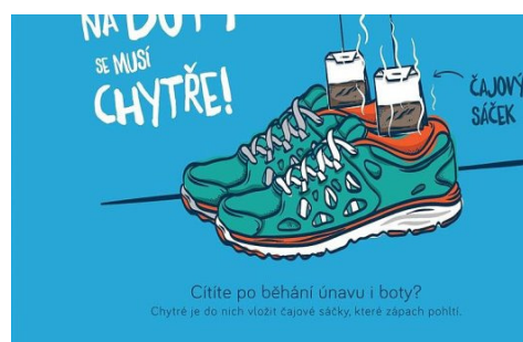
Cítí po běhání únavu i boty?

„Hlavním cílem kampaně je ukázat zákazníkům chytré nakupování – možnost porovnat si na Heurce cenu, přečíst si recenze a hodnocení zákazníků, srovnat si zboží podle zadaných parametrů. Zákazník má zároveň možnost